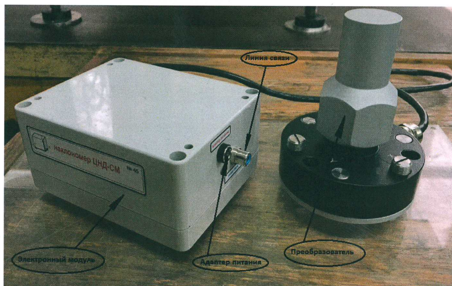
Рисунок 1 - Внешний вид наклономеров двухкоординатных цифровых ЦНД-СМ

В качестве регистрирующих устройств (вторичных преобразователей) для считывания выходных электрических сигналов наклономеров могут использоваться ПК, имеющие интерфейс RS-485 или же интерфейс USB. В первом случае измерители и ПК соединяются напрямую, во втором случае для соединения измерителей с ПК используется преобразователь интерфейсов RS485 / USB.